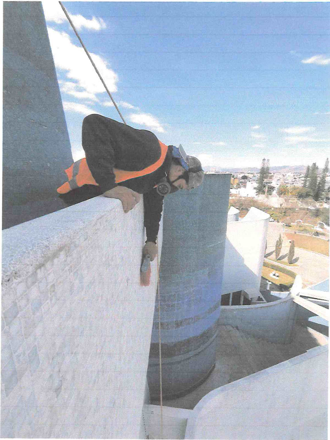
Limpieza y desinfección de teselas en segmento B1 de fachada Oriente.