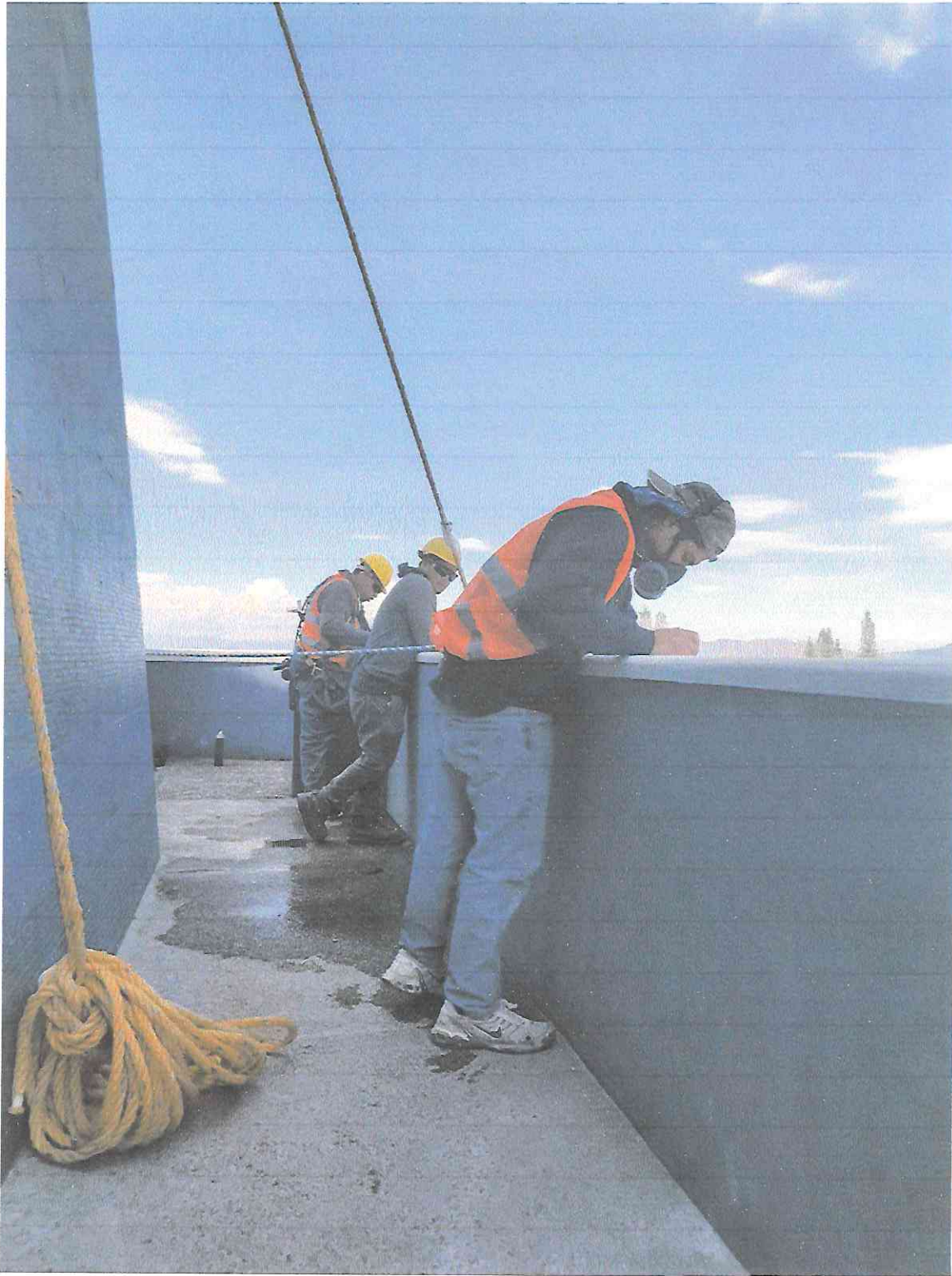
Limpieza y desinfección de teselas en segmento B1 de fachada Oriente.